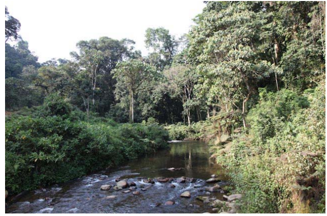
Ich war froh, dass alle Brücken passierbar