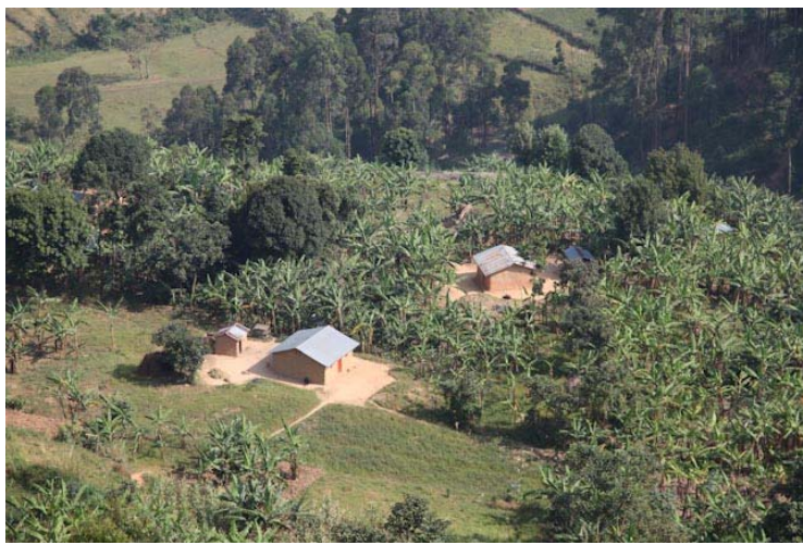
Es geht viele Pässe hinauf und herunter, die Aussicht schön über das bergige Land.