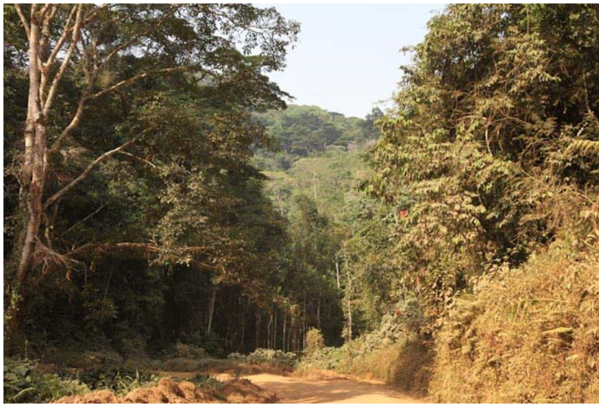
Schmale, einsame Piste durch den Urwald.